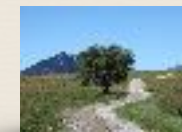
Plateau de Solaison

Gîte La Fruitière Plateau de Solaison 74130 Brison 04 50 96 93 56 gite-solaison@orange.fr